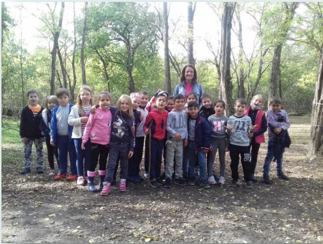
1.b osztály FTH