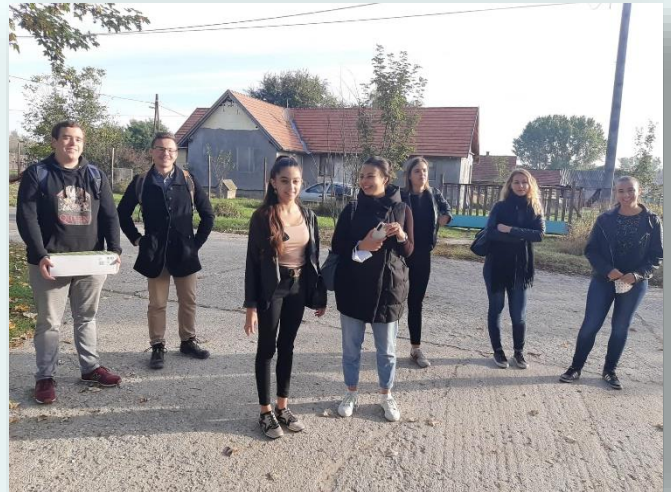
7. osztályosok és az ELTE hallgatói - mentorai FTH