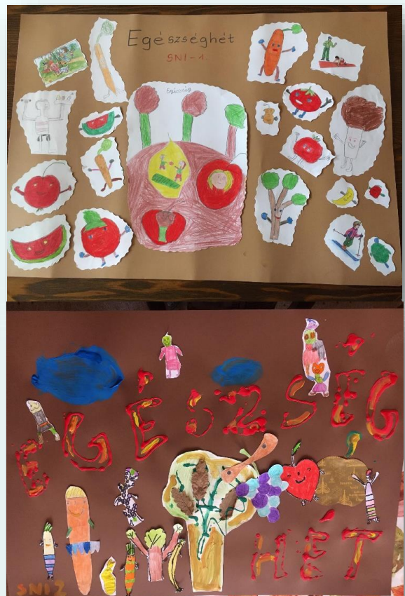
Egészség hét! SNI-1 és SNI-2 PLAKÁT