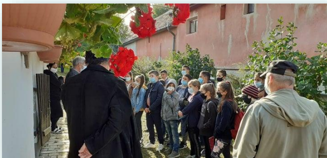
5. osztályosok FTH